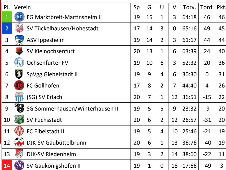
Tabelle unserer 2. Herrenmannschaft