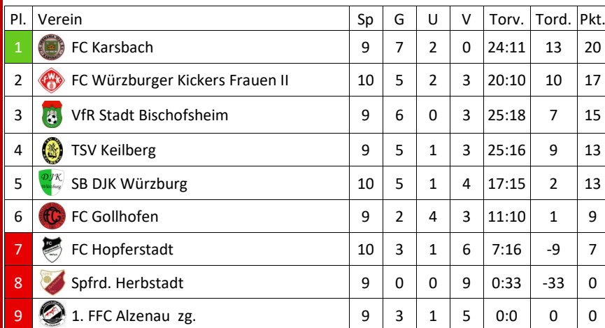
Tabelle unserer 2. Damenmannschaft